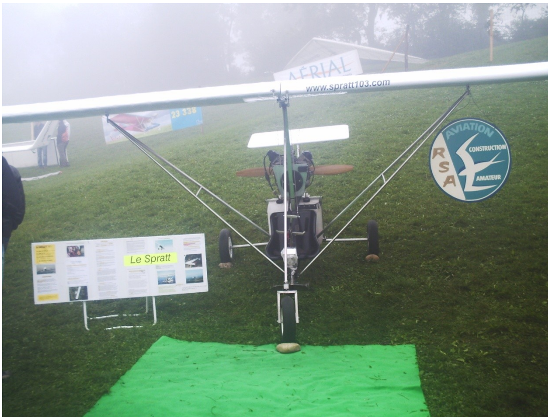
Spratt 103 à la Coupe Icare pendant les heures d'ouvertures