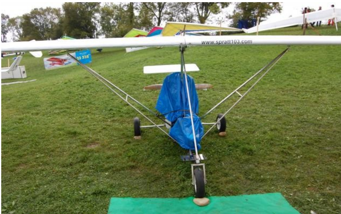
Spratt 103 à la Coupe Icare en dehors des heures d'ouvertures